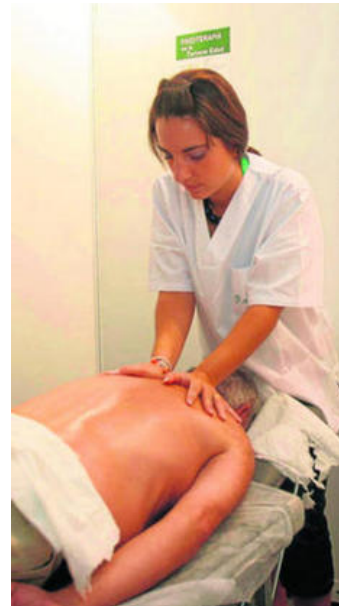
Los servicios de fisioterapia son muy demandados.

La Consejería de Salud cuenta actualmente con 16 salas de fisioterapia y rehabilitación en centros de salud y un equipo móvil en la provincia de Huelva, además de organizar talleres para cuidadores y atención a discapacitados.